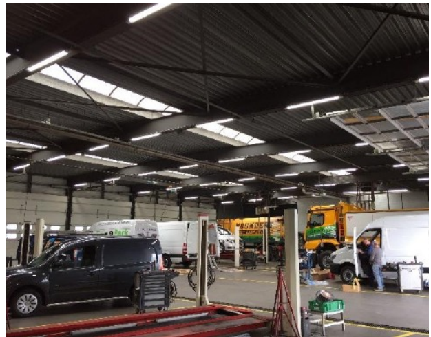
Mercedes (Goes, NL):

Dankzij een reële kleurweergave en hoge lumenoutput, is het armatuur een uitstekend werklucht voor allerlei doeleinden. Het werken met kleine onderdelen wordt in de mate van het mogelijke gemakkelijk gemaakt omdat het licht zich in elk donker hoekje wringt. Autogarages zijn hierdoor zeer genegen om met deze lamp te werken.